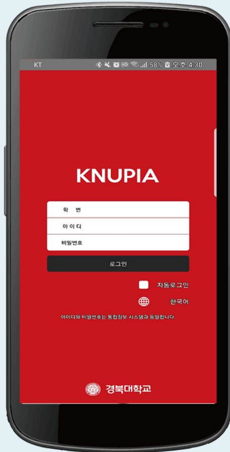
▲ 로그인 화면